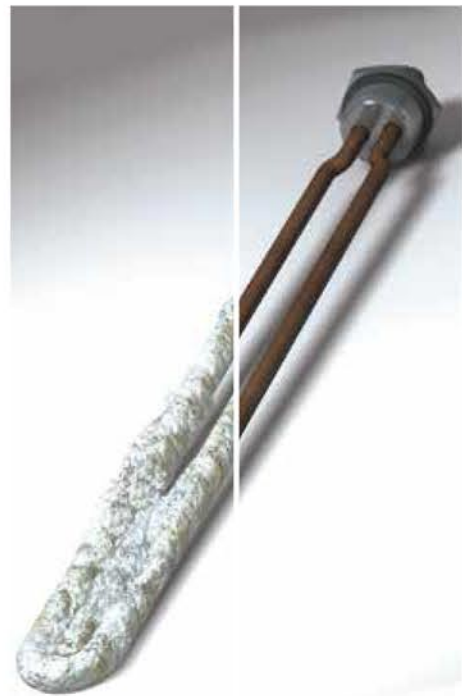
Vos appareils électroménagers tels que lave-linge, chauffe-eau, lave-vaisselle fonctionneront plus longtemps et nécessiteront moins de produits anticalcaires.