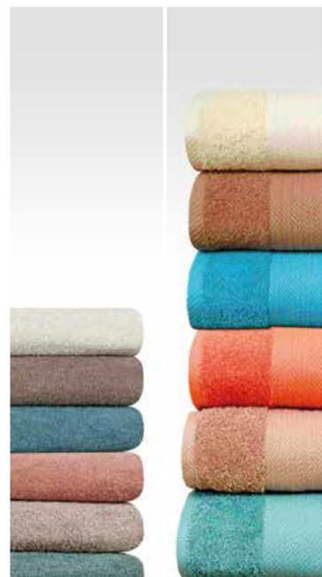
Vêtements plus propres, couleurs plus vives et tissus plus doux. Faites des économies en savon et assouplisseurs.