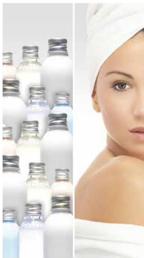
Bien-être dans la baignoire et la douche. L'eau adoucie est idéale pour les peaux sensibles. Réduisez vos dépenses en crèmes et produits hydratants.