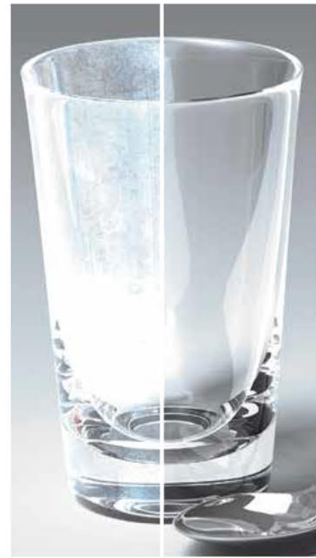
Verres et vaisselle protégés contre le calcaire. Faites des économies en achetant moins de produits chimiques anticalcaires.