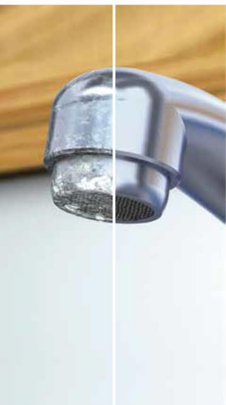
Conduits et robinetterie protégés et toujours étincelants.